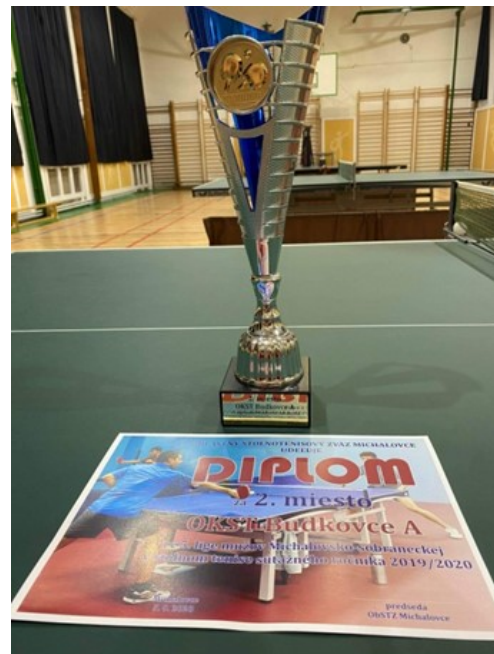
Cena za 2.miesto pre OKST Budkovce A v ročníku 2019/2020