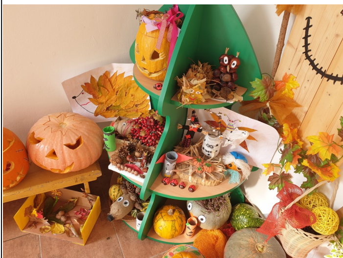
Práce našich detí